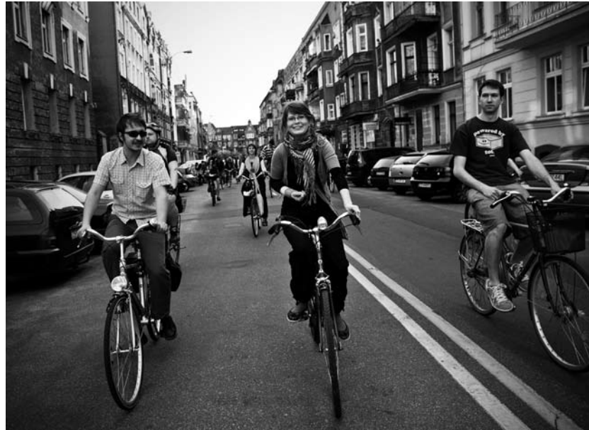
Szczecińska Rowerowa Masa Krytyczna w każdy ostatni piątek miesiąca gromadzi setki miłośników dwóch kółek.

szy sposób na poprawę bezpieczeństwa. Przy wyborze kasku należy zwrócić uwagę na kolor (jasny będzie widoczny dla innych uczestników ruchu) i odpowiednią wentylację. Po silnym upadku kask należy wymienić na nowy – w czasie uderzenia traci on bowiem swoje właściwości ochronne i w razie