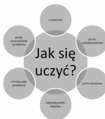
Schemat 1. Jak się uczyć? Opracowanie własne na podstawie opisu A. Janowskiego (2007).

różnorodnych działań związanych z zapamiętywaniem. Aby zwiększyć skuteczność nauki i przyswoić pożądaną wiedzę lub umiejętność warto różne działania łączyć lub przeplatać.