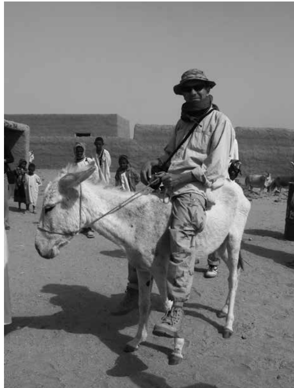
Field research in Sudan.

come up with the idea of creating a subdiscipline of science, which we have tentatively called ‘underwater ethnology’. It is modelled on underwater archaeology, which explores the sunken monuments of the past. So far ethnologists have rather reluctantly peered beneath the surface of water and yet it is also a cultural space in which human activity takes place and which contains various human artefacts. Various professional groups, such as divers, affect the underwater environment with their presence, exhibiting certain cultural and social behaviours, and we, as